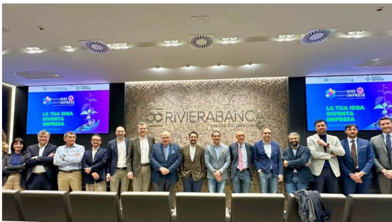
L'evento di presentazione

All'incontro di presentazione si sono susseguite le testimonianze di chi ha partecipato alla business plan competition ed ora è imprenditore affermato