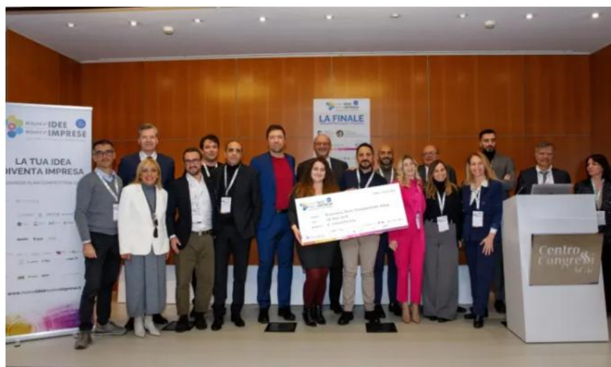
Nuove idee e Nuove imprese

Con la pubblicazione del bando e l'apertura delle iscrizioni si avvia la ventiquattresima edizione di Nuove Idee Nuove Imprese , la business plan competition che supporta le idee innovative per dare loro sostanza, cultura e connessioni e premia i progetti d'impresa più brillanti.