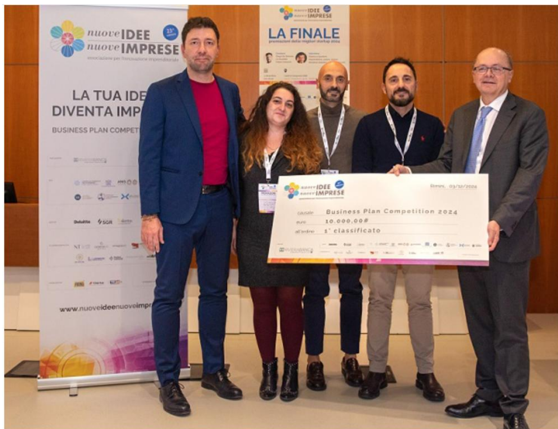
NUOVE IDEE E NUOVE IMPRESE - LA FINALE - premiazioni delle migliori startup Rimini (Centro SGR) 3 dicembre 2024 - Nella photo un momento della giornata finale

https://sestopotere.com/24esima-edizione-di-nuove-idee-nuove-imprese-in-palio-premi-per-21-000-euro-e-numerosi-benefits/