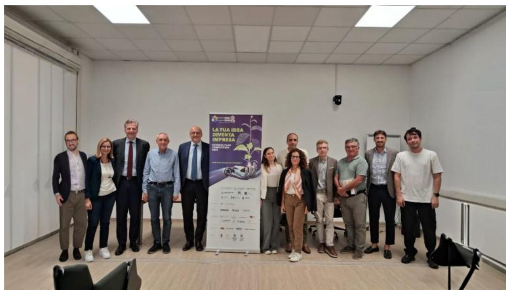
Il comitato tecnico scientifico

Il percorso ha visto al via 110 gruppi iscritti che hanno preso parte alla prima fase formativa gratuita, 7 finalisti hanno sede nella provincia di Rimini