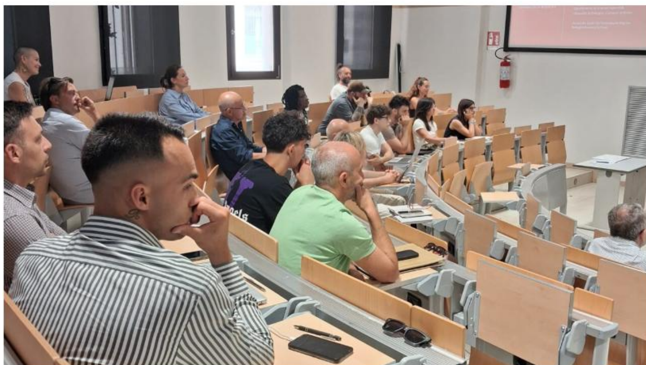
L'avvio della formazione

La maggior parte dei partecipanti - il 68% - proviene dall'Emilia-Romagna, con la Provincia di Rimini a farla da padrone con 34 partecipanti