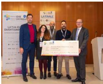
I vincitori del 2024

C'è tempo fino a oggi, al 31 maggio, per iscriversi alla ventiquattresima edizione di Nuove Idee Nuove Imprese, la business plan competition che supporta le idee innovative, offrendo un percorso formativo gratuito che rappresenta un'opportunità unica di cresci-