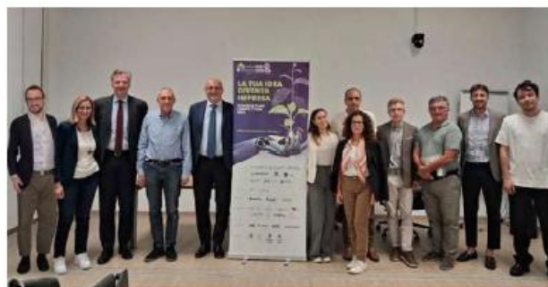
Il comitato tecnico scientifico

Tra i progetti Gilia , guida le PMI nell'adozione strategica dell'Intelligenza artificiale. Ars Iuris è invece un assistente legale AI-powered che integra tecniche Retrieval augmented generation per recuperare informazioni da fonti giuridiche e documenti interni, modelli linguistici avanzati e moduli dedicati alle diverse aree del diritto. Aurora Suite è una piattaforma di AI utile alla personalizzazione dell'apprendimento, grazie all'integrazione di valutazioni cliniche/pedagogiche con supporto umano. Birole supporta piccole imprese e artigiani a incrementare i guadagni e massimizzare l'efficienza ope-