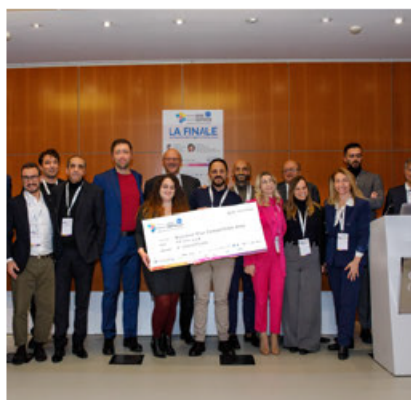
I vincitori del 2024

Con la pubblicazione del bando e l'apertura delle iscrizioni si avvia la ventiquattresima edizione di Nuove Idee Nuove Imprese, la business plan competition che supporta le idee innovative per dare loro sostanza, cultura e connessioni e premia i progetti d'impresa più brillanti. In palio un montepremi complessivo di 21.000 euro che sarà assegnato alle idee